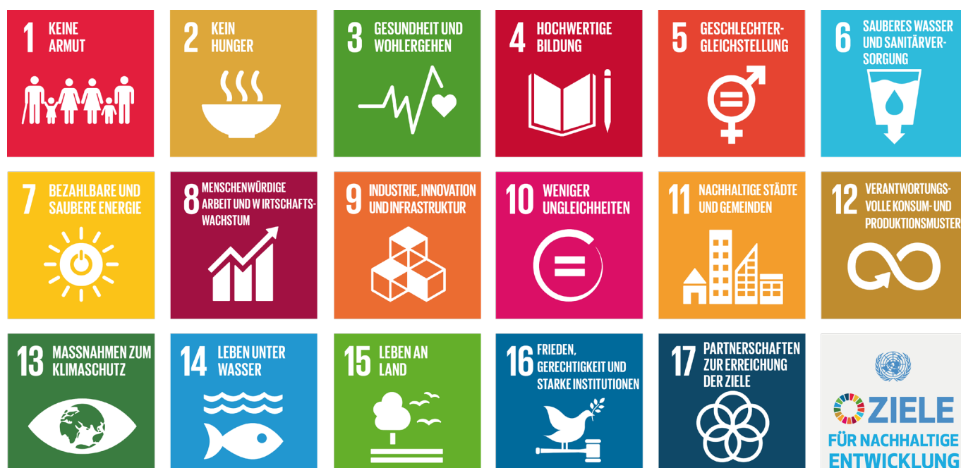
Abbildung 1: Übersicht der 17 UN-Nachhaltigkeitsziele für nachhaltige Entwicklung

In Ziel 4, das inklusive, gleichberechtigte und hochwertige Bildung im Kontext des lebenslangen Lernens für alle fordert, ist Bildung für nachhaltige Entwicklung eines der wichtigen Unterziele. In der